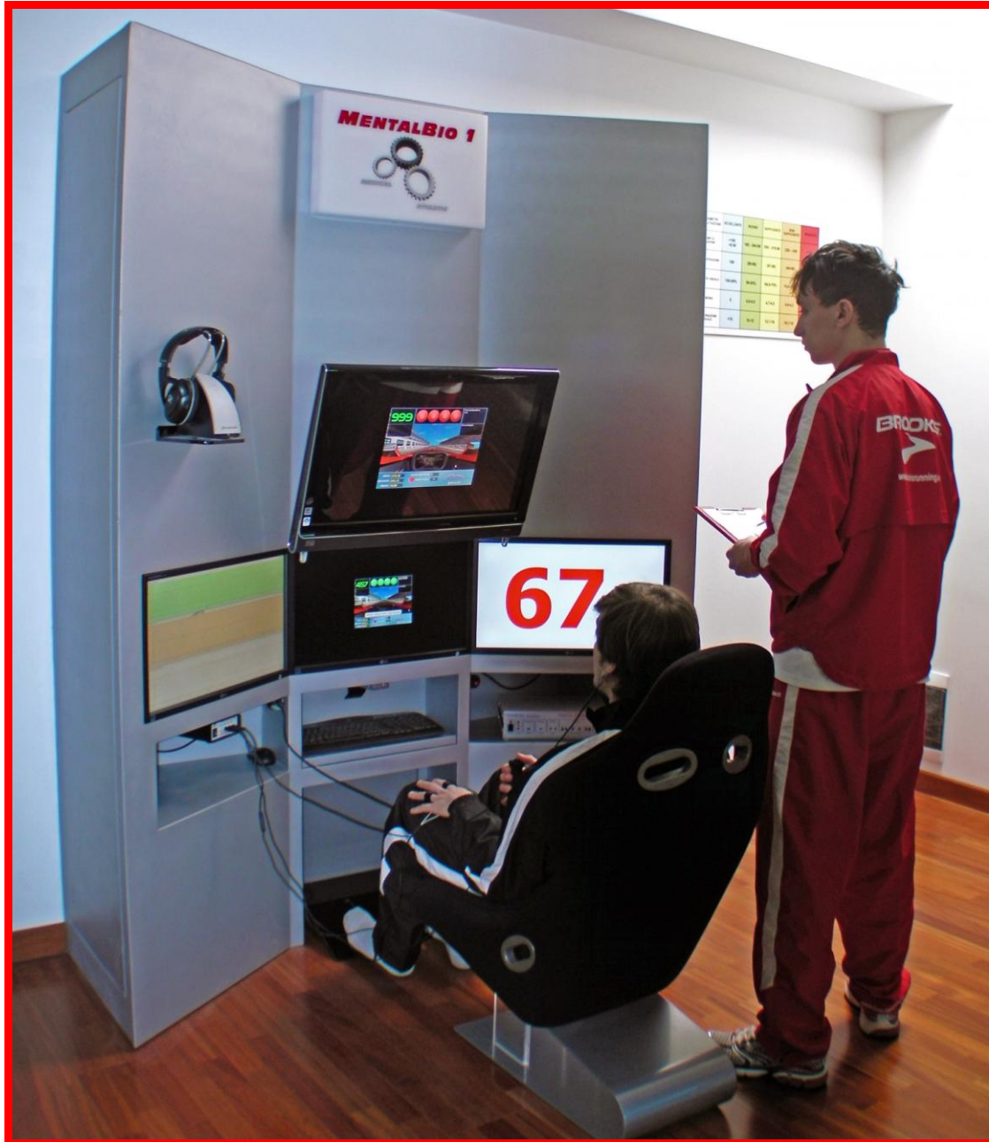
MentalBio Dual Task